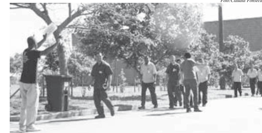
Diretores do SNA convidam trabalhadores à votação

Nem todas as apurações chegaram às mesmas conclusões. A votação realizada pelo outro sindicato do Rio de Janeiro apontou que 65% dos profissionais desejam manter o acordo. A direção do SNA questiona o resultado. “Eles fizeram a assembleia dentro da empresa, na presença de diretores que poderiam influenciar na decisão do trabalhador. Enquanto apuramos os vo-