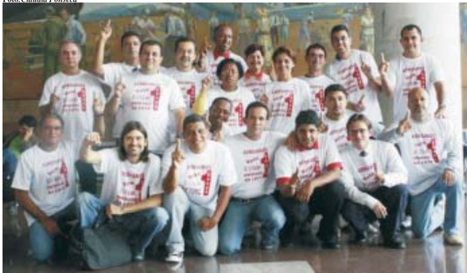
Chapa Unidade da Luta em campanha no Aeroporto Santos Dumont