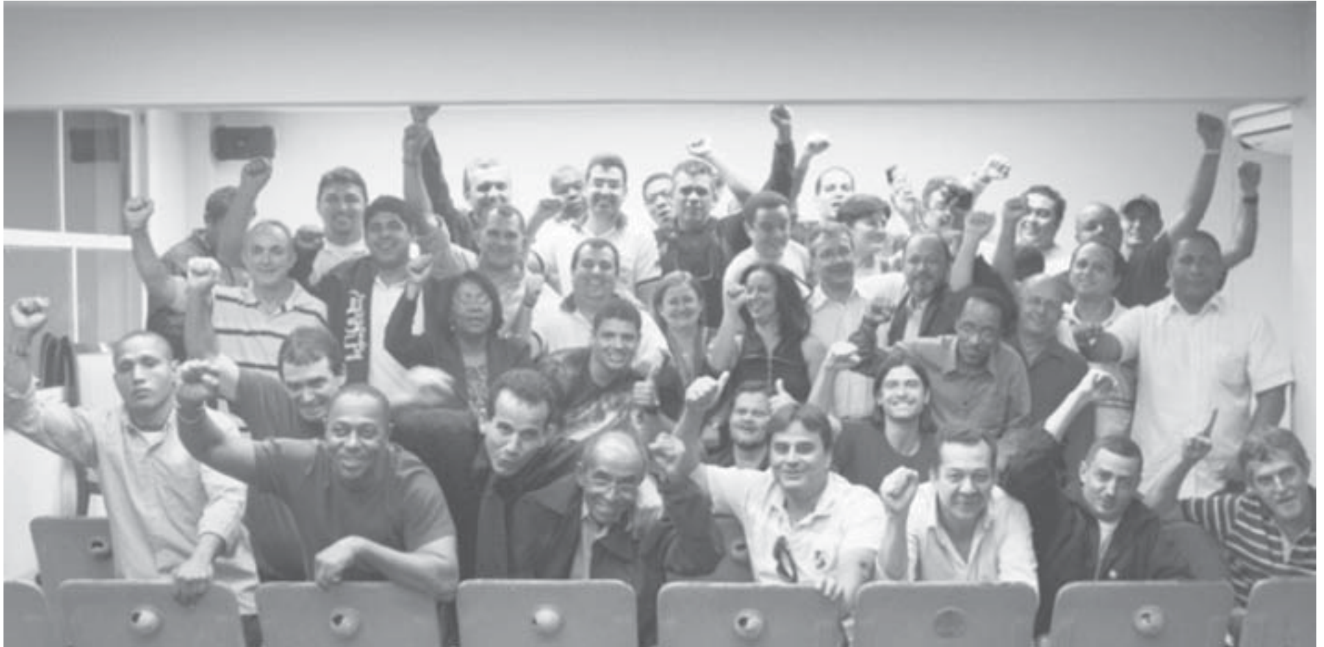
Chapa Unidade da Luta depois da vitória