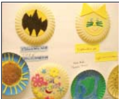
A atividade em pratos de papelão trabalha com a criatividade das crianças