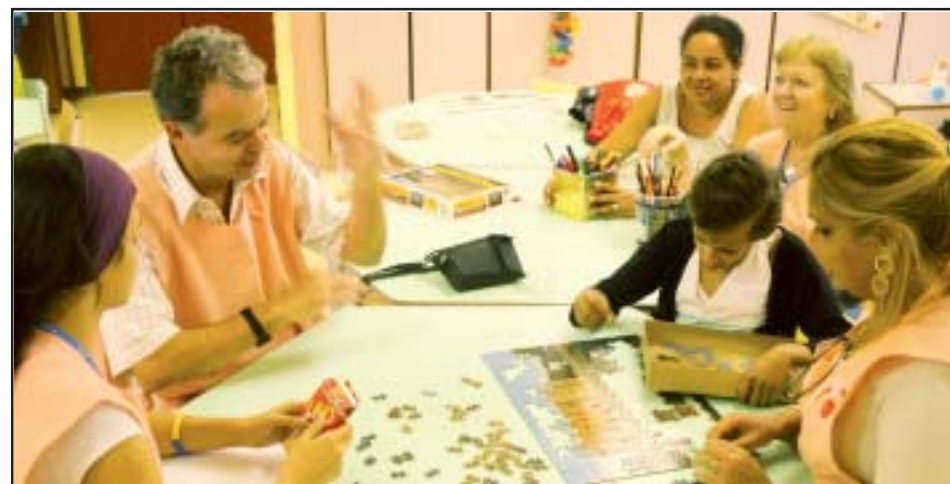
Voluntários incentivam a participação dos pais nas atividades recreativas