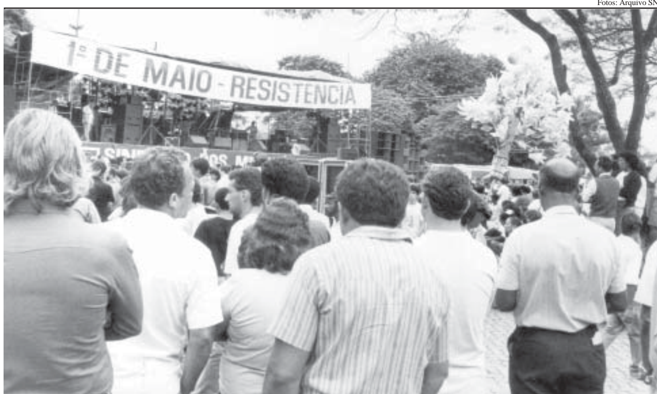
1º de maio: uma histórica referência na luta de classes

De nossa parte, não falta empenho em buscar soluções para os problemas conjunturais do setor. Sabemos, por exemplo, que quem regula os preços do querosene de aviação – que a esta altura é um dos principais vilões da crise – é o