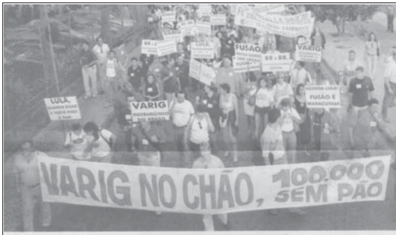
Trabalhadores da Varig mobilizados contra o desemprego

mercado internacional do petróleo. E, pensando nisto, participamos com propostas, trabalhando em cima de possíveis soluções para o impasse, através do Conselho Nacional de Aviação Civil (CoNAC). As 18 resoluções já elaboradas minimizariam os males da alta dos preços. Só que a inoperância e a falta de compromisso do governo Lula engavetaram tudo, deixando o setor aéreo abandonado à própria sorte – ou seria ao próprio azar? Por enquanto, apenas quatro resoluções saíram do papel.