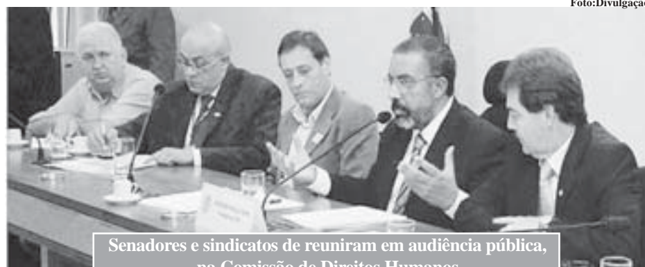
Senadores e sindicatos se reuniram em audiência pública, na Comissão de Direitos Humanos

que os aposentados recebem mensalmente do INSS, é necessário multiplicar a média dos salários de con-