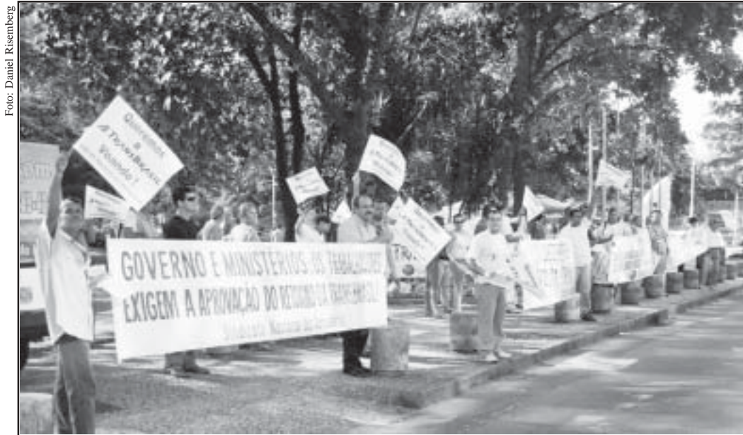
MANIFESTAÇÃO e luta pelo resgate dos postos de trabalho na Transbrasil

No dia nove de dezembro último, o Aeroporto Santos Dumont, no Rio, foi palco de uma das manifestações mais significativas para o setor aéreo. Entre funcionários e aposentados, aeroviários e aeronautas, liderados pelos sindicatos filiados à Federação dos Trabalhadores da Aviação Civil (FENTAC CUT), revelaram o grau de insatisfação que as negociações para o retorno da Transbrasil estão tomando. Em apoio à retomada das operações da empresa, é consenso que a luta dos trabalhadores só termina quando o governo – leia-se INFRAERO – ceder os espaços aeroportuários à Transbrasil. Afinal, emprego e salário em dia só faz bem; mais ainda para quem está na meta de gerar 10.000.000 de postos de trabalho.