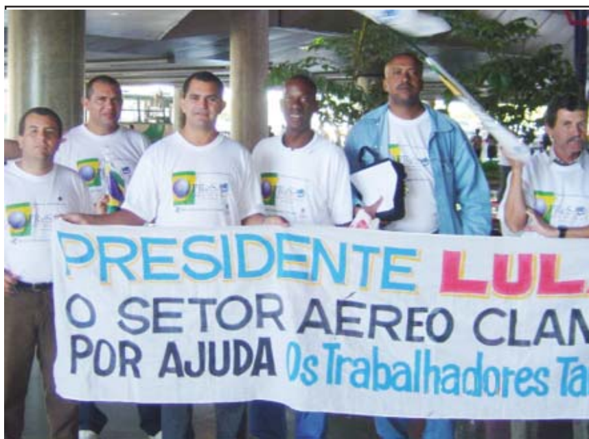
Solução para a crise passa também pela equipe econômica de Lula

A palavra-de-ordem acima foi o apelo que os trabalhadores fizeram ao Governo Federal, em Brasília, nos dias 16 e 17 de maio últimos. Afinal, até agora, não vimos um sinal claro de que a equipe de Lula esteja realmente interessada em conter a sangria do desemprego no setor. E enquanto nada muda, vale o protesto: “Dignidade já!”