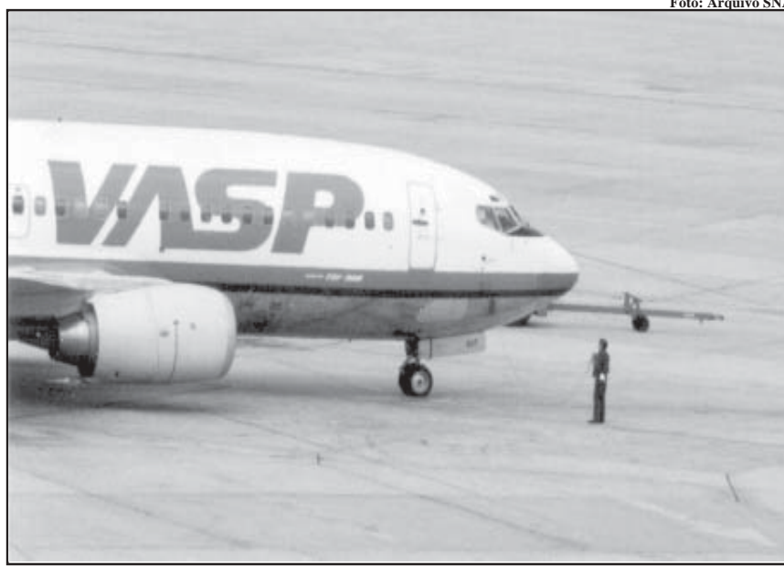
Antes da crise: aviões e trabalhadores da Vasp em plena atividade

Há uma empresa interessada em se tornar acionista da VASP. É a GBDS S/A, cujas negociações são uma incógnita para os trabalhadores, pois pesa sobre a empresa a suspeita de ser fantasma. No entanto, o que realmente interessa no momento – nossas pendências trabalhistas – foi abordado e está bem claro no documento oficial, elaborado após a decisão da justiça trabalhista. Vamos fiscalizar. Caso Canhedo não honre sua palavra e não pague as dívidas, a intervenção continua valendo, com seus bens permanecendo indisponíveis.