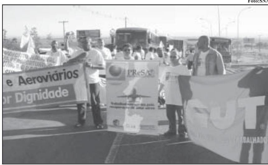
Sindicatos cutistas do setor e outros movimentos sociais se encontram em Brasília

No dia 16, em companhia destes companheiros, cercamos o prédio da