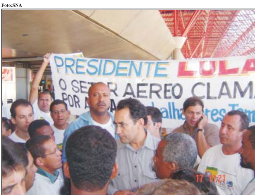
Trabalhadores exigem que governo atente para as propostas do PRSA