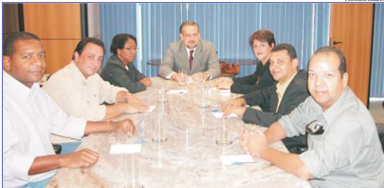
Dirigentes sindicais do setor aéreo encaminham reivindicações ao ministro do Trabalho

Na reunião, abordamos ainda que o excesso de horas extras dificulta a contratação de novos fun-