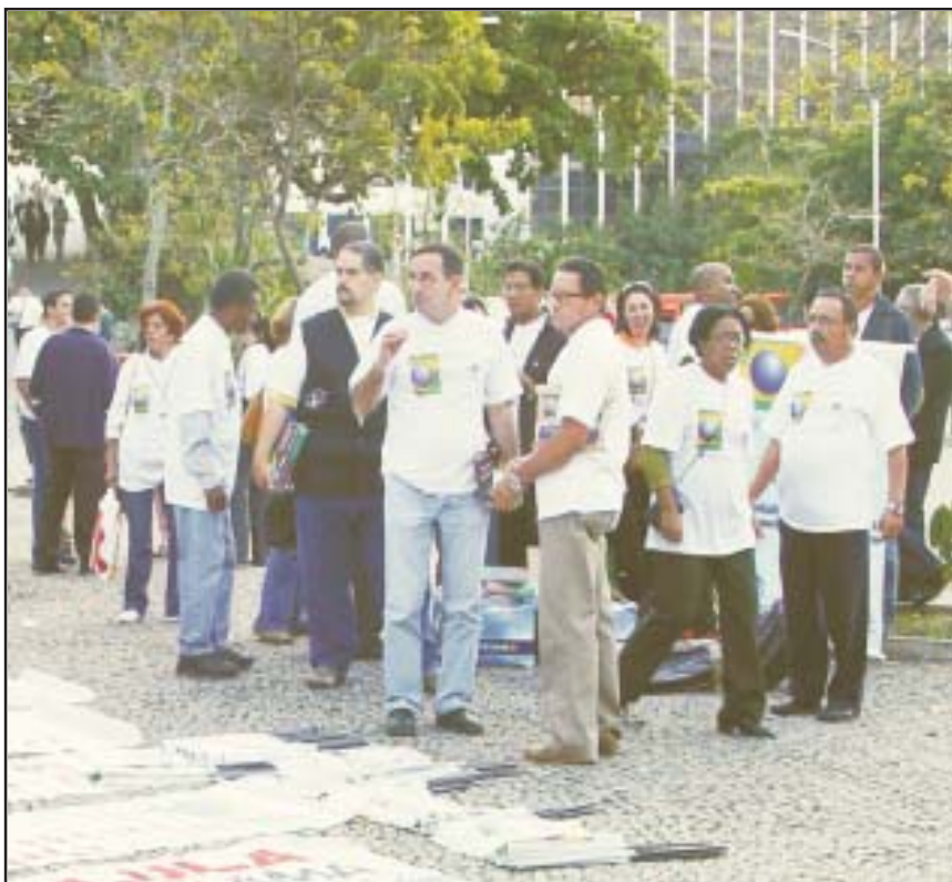
PARA salvar a empresa, Varig e VEM pedem ajuda dos trabalhadores...

Ou seja, com o não recebimento dos respectivos reajustes, as contribuições previdenciárias também ficarão no prejuízo. O déficit no INSS, para estes trabalhadores, se ampliará, através de contribuições de menor escala, principalmente para quem requereu aposentadoria nos últimos 12 meses.