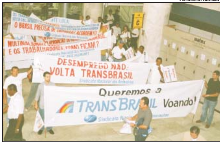
PELO emprego e pela vida, Sindicatos cutistas do setor marcam presença a favor dos trabalhadores

Tribunal de Justiça de São Paulo decretou a falência da companhia aérea, através de um requerimento da General Eletric, uma das credoras da Transbrasil. Em dezembro daquele ano, o ministro Eros Grau suspendeu a ação da GE, mantendo-a em fevereiro de 2005. Com a suspensão da falência assegurada, a