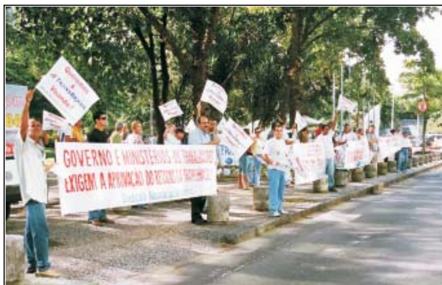
NOSSAS famílias não podem esperar: a TRANSBRASIL tem que voltar!

Em declaração ao Jornal do Brasil (13/01/2006), a empresa afirmou que a decisão do Planalto não faria sentido, já