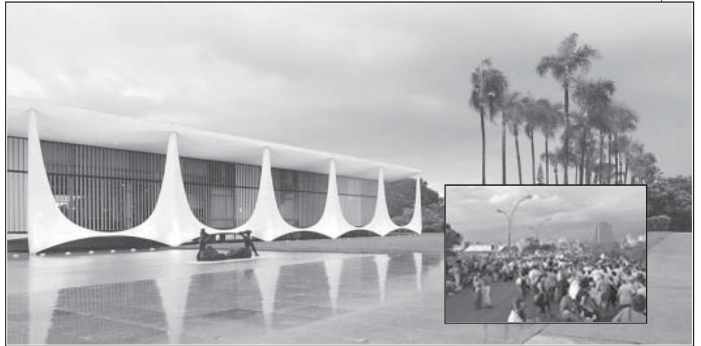
Situação dos aposentados do Aerus-Aeros: No detalhe, trabalhadores encaminharam suas demandas às autoridades federais.