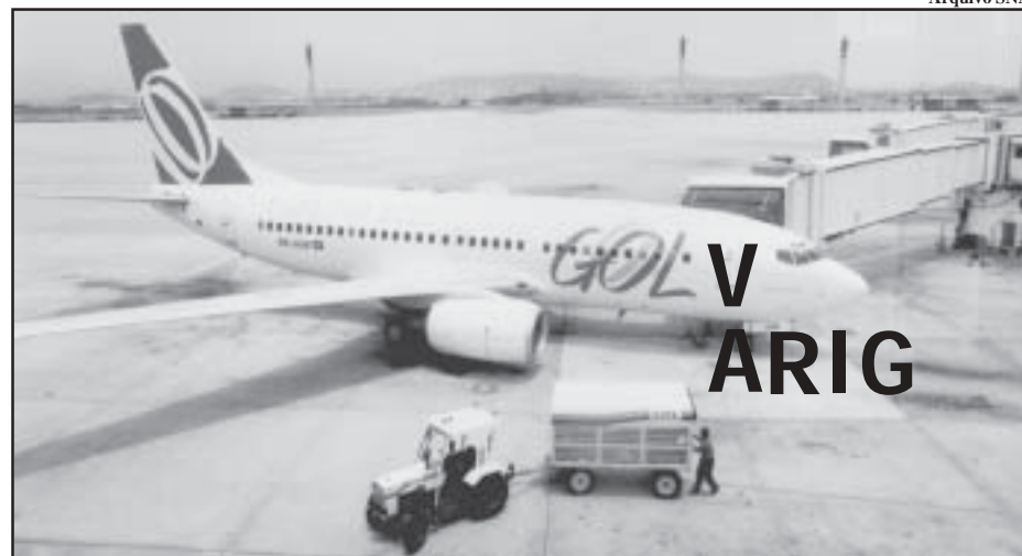
Os funcionários da Varig precisam trabalhar na empresa que foi comprada pela Gol