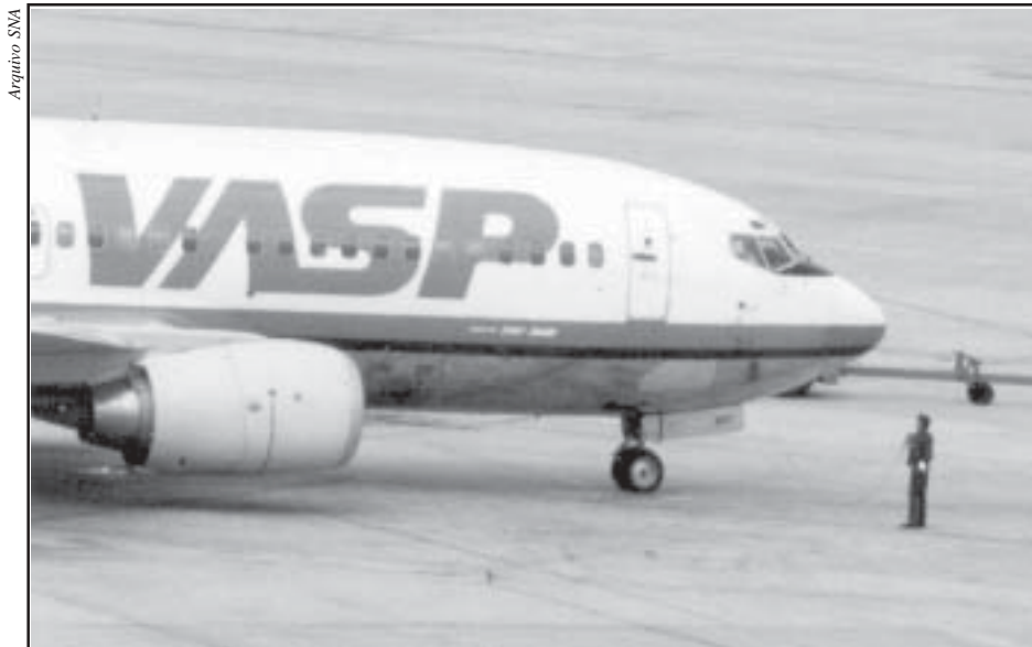
Para voltar a voar, a Vasp precisa quitar suas dívidas com toda espécie de credores